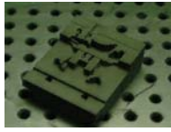
Construire la pièce "verte"