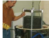
Placer dans le four pour délanter et infiltrer