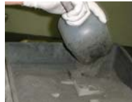
Couvrir la pièce verte et le bronze pour infiltration de poudre d'alumine