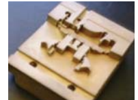
Finir si nécessaire