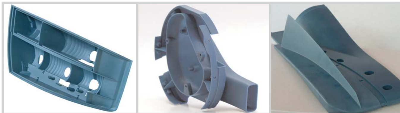
Pièces aérodynamiques et fonctionnelles produites en plastique nanocomposite Bluestone. Images (au centre et à droite) avec l'aimable autorisation de l'équipe Renault F1.

Un nanocomposite technique très rigide, ouvrant de nouvelles possibilités aux utilisateurs de stéréolithographie.